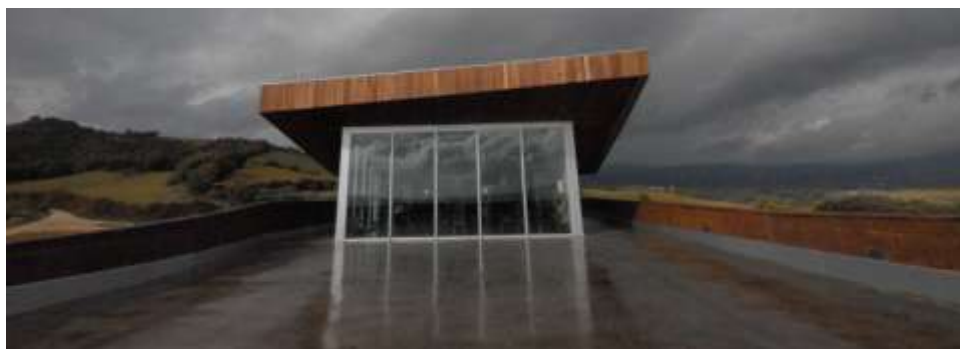
Terraza Restaurante AROA Entregarnatxas. Otoño 2010.

Tienda de Vinos , la Bodega ofrece la posibilidad de adquirir sus vinos en unas condiciones y a unos precios únicos, “de bodega”, pudiendo degustarlos previamente si es su deseo, completando su visita en AROA Bodegas con la compra de los vinos que ha disfrutado. Cajas, estuches, preparados para realizar una compra o regalo ideales.