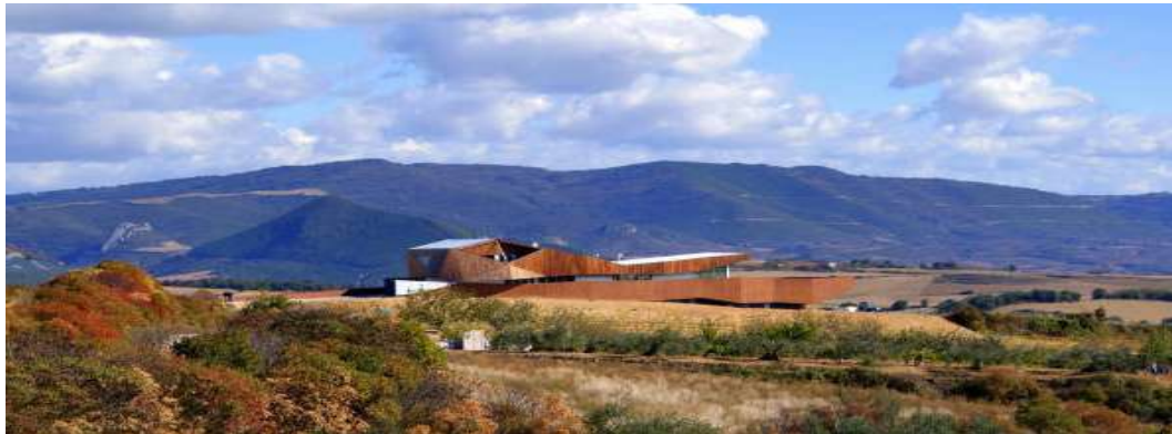
Aroa Bodegas. Valle de Deierri. Otoño 2010.